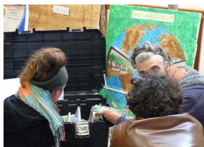
Malle d'ouvrages liés au Jardin Parc Naturel Anjou-Touraine - Delphine Chapon