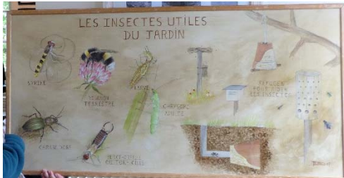
Les différents refuges d'insectes à installer au jardin Couleurs Sauvages – Thalie Blanc